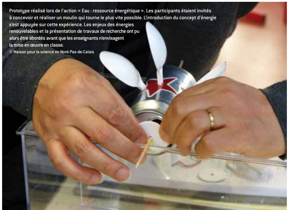
Prototype réalisé lors de l'action « Eau : ressource énergétique ». Les participants étaient invités à concevoir et réaliser un moulin qui tourne le plus vite possible. L'introduction du concept d'énergie s'est appuyée sur cette expérience. Les enjeux des énergies renouvelables et la présentation de travaux de recherche ont pu alors être abordés avant que les enseignants n'envisagent la mise en œuvre en classe.

L'équipe de la Maison pour la science est au service des professeurs. Elle intervient sur l'ensemble du territoire de l'académie. Certaines actions favorisent dans la transition école-collège. La plupart offrent un éclairage pluridisciplinaire sur un sujet scientifique et