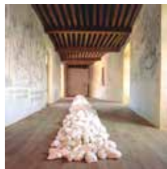
œuvre de R. Long

Tous les trois mois environ, le musée propose une nouvelle exposition temporaire et des activités en lien avec celle-ci. Il possède également un fonds consacré à l'artiste Raoul Hausmann (1886-1971) un des membres fondateurs du mouvement Dada à Berlin, pionnier du collage et de la poésie sonore. Un espace permanent lui est consacré.