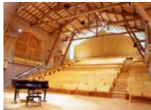
Cl. Ferme de Villefavard