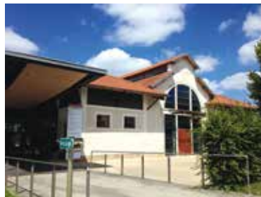
Cl. La Mégisserie