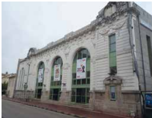
Cl. Théâtre de l'Union

Carte Culture • 12 € au lieu de 19 € mgen 87