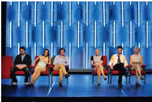
(« Solidarité » texte et mise en scène Gianina Carbanariu, par le Théâtre National Radu Stance de Sibiu (Roumanie).