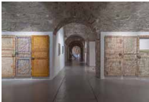
Exposition Stéphanie Cherpin, Le paysage ouvre à heures fixes (février > juin 2014)

Le FRAC et L'Artothèque du Limousin ont fusionné pour créer le FRAC-Artothèque du Limousin au 1er janvier 2015. Il rassemble ainsi plus de 6000 œuvres dans ses collections (FRAC, Artothèque, Faclim), organise des expositions, des actions culturelles (visites, ateliers, cours d'histoire de l'art, lectures...), et des projets en partenariat. La collection de l'Artothèque est accessible au prêt pour les particuliers, les collectivités et entreprises à travers quatre relais sur le territoire régional (Limoges, Tulle, Guéret, CIAP de Vassivière).