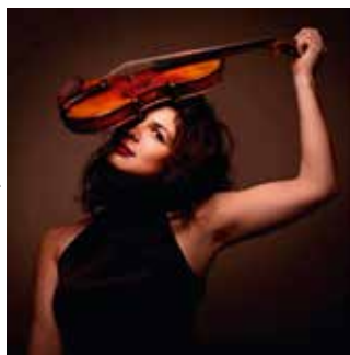
(d. S. Nemtanu, Ferme de Villefavard)

Au commencement on trouve un territoire, le Pays du Haut Limousin. Une envie commune nous prend à le sublimer, à le mettre en mouvement et à le rendre attractif. Puis viennent les lieux patrimoniaux - les églises, les châteaux, les paysages naturels, la Ferme de Villefavard... - les enveloppes acoustiques des concerts et spectacles.