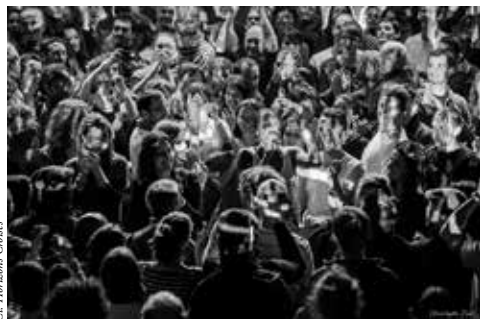
Cl. Horizons Croisés