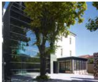
Musée national Adrien Dubouché, Limoges : façade de Boris Podrecca.

Fermeture les 25 décembre et 1 er janvier.