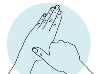
5 Pouces Désinfection des pouces