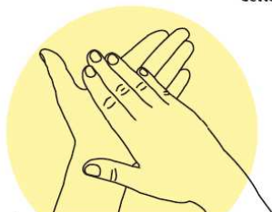
1 Paume sur paume Désinfection des paumes

La friction est réalisée en 7 points et renouvelée autant de fois que possible dans la durée impartie. Cette durée sera d'au moins 20 secondes et à définir en fonction du produit.