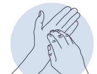
6 Ongles Désinfection des ongles