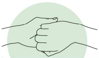
4 Paume/doigts Désinfection des doigts