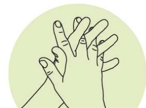
3 Doigts entrelacés Désinfection des espaces interdigitaux et des doigts