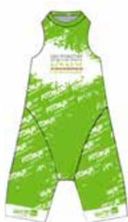
meilleur jeune homme (addition du temps de chaque étape pour les jeunes nés en 2001 et 2000)