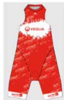
Meilleur coureur (en additionnant les temps course de chaque étape)