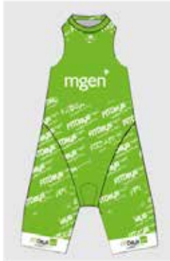
Leader du classement général individuel homme et femme (addition du temps de chaque étape)