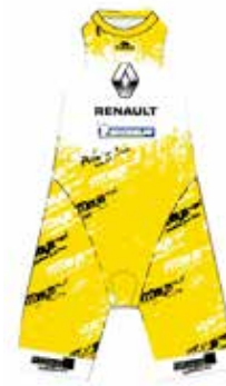
Meilleur cycliste (en additionnant les temps vélo de chaque étape)