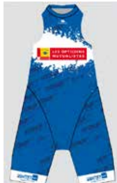
Meilleur nageur (en additionnant les temps natation de chaque étape)