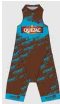
Plus combatif (addition des points lors du sprint vélo)