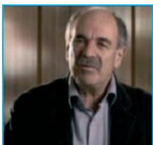
Michel Wievorka, sociologue

« La crainte de l'autre est une réaction primitive et animale et, en même temps, les enfants sont très peu sensibles au racisme. Il y a une dimension culturelle très forte. »