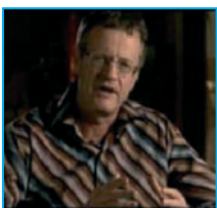
Pascal Boniface, géopoliticien

« L'éducation permet aux enfants de comprendre dans quel monde ils sont. [...] Le colonialisme et le racisme sont des héritages du passé dont nos sociétés portent encore aujourd'hui les stigmates. »